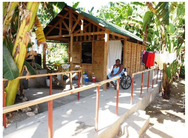
© Handicap International – Abri avec rampe d'accès

En décembre 2011, un total de 1.050 habitats transitoires a été livré, permettant l'installation de près de 5.000 personnes.