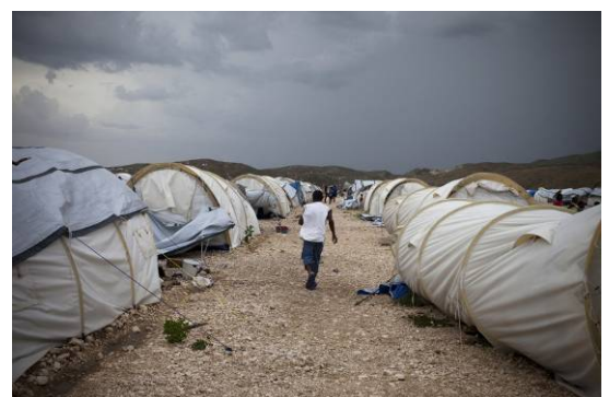
Corail Cesse Lesse, Camp de déplacés après une tempête.