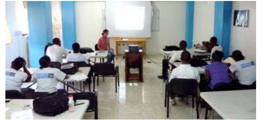
Séance de formation

L'objectif de Handicap International est de créer et de coordonner une capacité de réadaptation et d'appareillage sur le long terme. Pour cela, l'association forme du personnel haïtien qui pourra assurer la pérennité des services. Actuellement les spécialistes de notre association travaillent en collaboration avec du personnel haïtien et expatrié de l'association Healing Hands for Haiti à l'élaboration d'un programme de formation diplômante qui permettra d'accroître encore notre travail de transfert de compétence et l'impact à long terme de notre intervention.