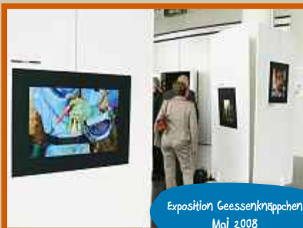
Exposition Geessenknäppchen Mai 2008