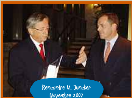
Rencontre M. Juncker Novembre 2007