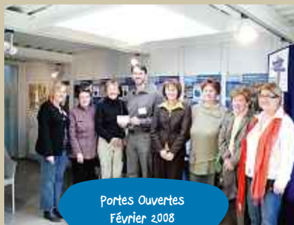
Portes Ouvertes Février 2008