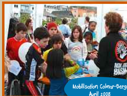
Mobilisation Colmar-Berg Avril 2008