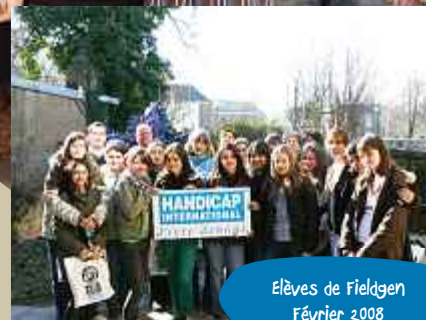
Elèves de Fieldgen Février 2008