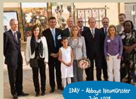
IDAY - Abbaye Neumünster Juin 2008