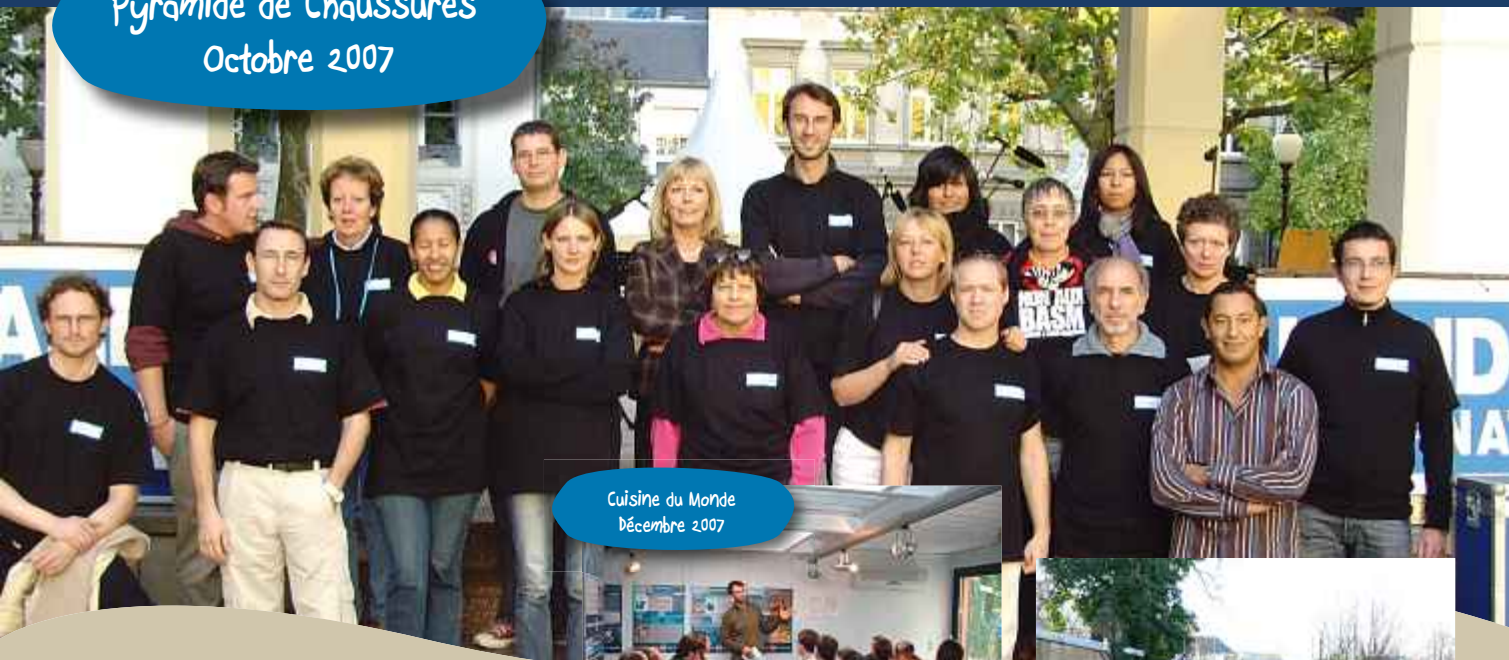
Cuisine du Monde Décembre 2007